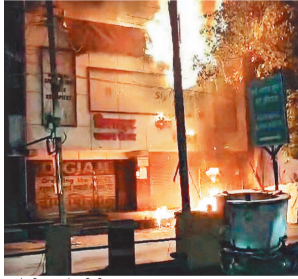
कपड़े की दुकान में लगी भीषण आग।

जिले में आगजनी की घटना थमने का नाम नहीं ले रही है। बारिश का सीजन शुरू होने के बाद भी आग लगने की घटनाएं जारी हैं। रविवार की रात एक कपड़ा दुकान में देर रात आगजनी की घटना सामने आयी। दमकल की टीम को आगजनी की सूचना मिलने पर टीम मौके पर पहुंची और घंटों मशकत के बाद आग को काबू किया गया। इस आगजनी की घटना से दुकान संचालक को लाखों का नुकसान होने की संभावना जताई जा रही है। कोतवाली थाना क्षेत्र अंतर्गत संचालित डिलाइट क्लॉथ में रविवार की देर रात लगभग 10:20 बजे आग लगने की घटना घटित हो गई। जिस वक्त यहां आग लगी दुकान बंद हो चुकी थी और संचालक सहित कर्मचारी घर जा चुके थे। एकाएक आग लगने की सूचना फैलते ही आसपास के दुकानदारों में हड़कंप मच गया और आग को बुझाने का प्रयास शुरू कर दिया गया। कोतवाली पुलिस और दमकल वाहन वहां पहुंचे