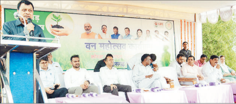
कार्यक्रम को संबोधित करते उद्योग मंत्री लखनलाल देवांगन।