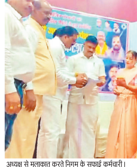
अध्यक्ष से मुलाकात करते निगम के सफाई कर्मचारी।