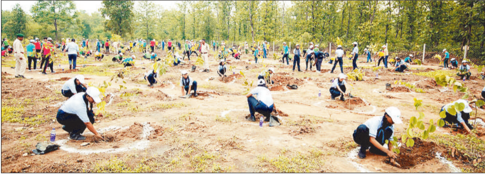
पौधरोपण करते स्कूल के छात्र व स्वच्छता दीदी।