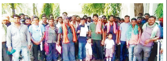
कान से निकाला, नगदूरो के सामने रोजी-रोटी की समस्या

एसईसीएल की मेगा प्रोजेक्ट एसईसीएल कुसमुंडा खदान के अधीन कार्यरत एक निजी कंपनी प्रबंधक पर खदान में कार्यरत 110 कर्मचारियों को बिना सूचना व नोटिस दिए काम से निकाल देने का आरोप लगाया गया है। जिससे सैकड़ों मजदूर बेरोजगार हो गए, उनके सामने रोजी रोटी की समस्या आ रही है। जनदर्शन में अपनी शिकायत लेकर कलेक्टर पहुंचे मजदूरों ने एक निजी कंपनी पर आरोप लगाया है। कुछ लोगों के द्वारा खदान में हुसकर दादागिरी व मारपीट की जाती है। मजदूरों का कहना है कि निजी कंपनी के प्रबंधक ने सभी मजदूरों को कंपनी में काम देने से साफ मना कर दिया है। उक्त मामले से मजदूरों ने एसईसीएल कुसमुंडा प्रबंधक को भी अवगत कराया है।