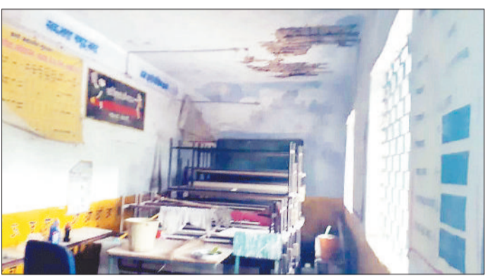
रिस्टा प्राथमिक शाला जहां एक रूम में ही स्टाफ और लगी है कक्षाएं।