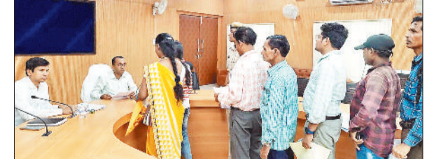
समस्याएं सुनते कलेक्टर।