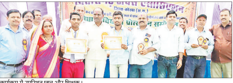
कार्यक्रम में उपस्थित छात्र और शिक्षक