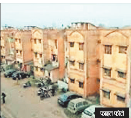
हाउसिंग बोर्ड द्वारा जिले के शहरी क्षेत्र के साथ उपनगरीय क्षेत्रों और ब्लॉक मुख्यालय में अपनी आवासीय योजना

हरिभूमि न्यूज ►► कोरबा हाउसिंग बोर्ड के आवासीय विस्तार योजना के लिए होम गार्ड कार्यालय के पीछे आबंटित